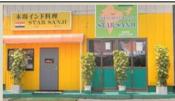
店舗外装リニューアルによる集客