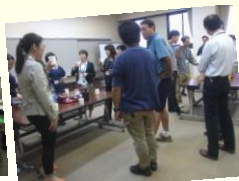
講師を囲んだ交流会もあります