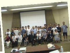
今年はあなたが参加する番です