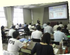
昨年開催の講座の様子

創業して実際に儲かるための顧客獲得や売上作りなど、実践的な内容を豊富に学ぶことができます。ぐんま創業スクールでは、自分のやりたいことで「創業」の実現を目指すだけではありません。そして、意欲的な創業仲間を増やすことも含めて、 一生の財産を手に入れることができる のです。