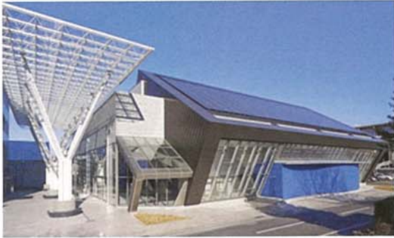
会場 (ビエント高崎 展示ホール) 外観