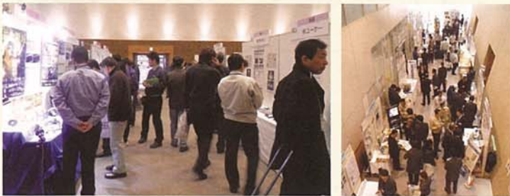
前回開催時(群馬産業技術センター)の様子

出展分野 医療・ヘルスケア、環境・新エネルギー、切削、プレス・板金、 溶接、表面処理、金型、樹脂、鍛造・鋳造、電気・電子、 設備・装置、ソリューション 他 『医療・ヘルスケア』分野を新設!