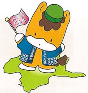
群馬県のマスコット 「ぐんまちゃん」